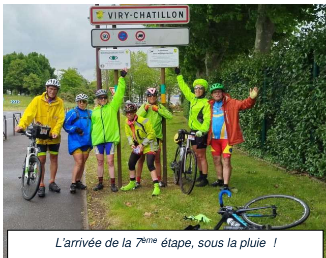
L'arrivée de la 7 ème étape, sous la pluie !

Le CoDep des Bouches-du-Rhône travaillait depuis 3 ans sur ce projet, et bien qu'habitant l'Essonne j'ai eu la chance de participer au voyage de Miramas à Paris : environ 850 km, 8000 m de dénivelé positif, en 7 étapes ! 45 participants dont 3 accompagnateurs aux petits soins pour ceux qui roulaient.