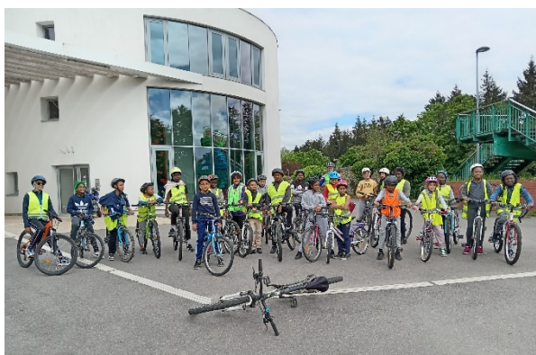
Bloc3 ; Un groupe d'Ormoy à la piscine de Mennecey

Ormoy : Ici aussi c'est le CoDep qui assure les 3 blocs dans les 2 groupes scolaires. 30 élèves à Pasteur et 25 à St Jacques, une belle réussite et des enfants là encore très motivés et heureux de pratiquer à chaque bloc. Cerise sur le gâteau lors de la sortie : passer au parc de Fontenay-le-vicecomte ou dans les allées du parc de Villerooy à Mennecey. C'est plus dur dans les rues d'Ormoy quand il faut monter sur le plateau depuis la mairie, mais tout le monde y arrive.