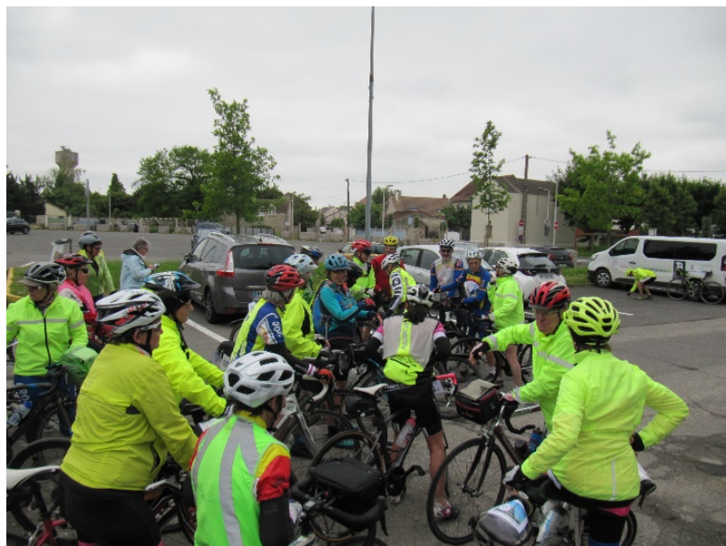
Rencontre et briefing avant le départ pour rejoindre Villeneuve St Georges

Comme beaucoup de clubs franciliens, les cyclos du Bondoufle Amical Club ont également participé à l'accompagnement de groupes provinciaux dans le cadre de l'opération Ensemble à Paris 2024 de notre fédération de cyclotourisme. J'avais tout d'abord eu contact avec un groupe de Dacquois qui devait passer par Bondoufle, mais finalement leur lieu d'hébergement étant dans le 94, ils ont modifié leur parcours et sont passés plus à l'est de la Seine.