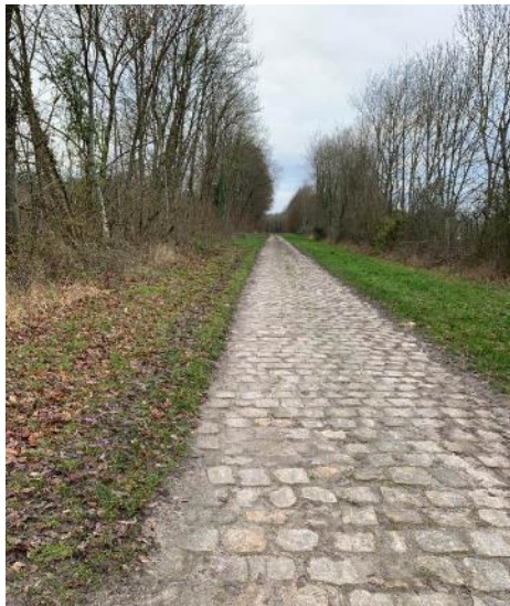
Rue pavée à Saint-Chéron