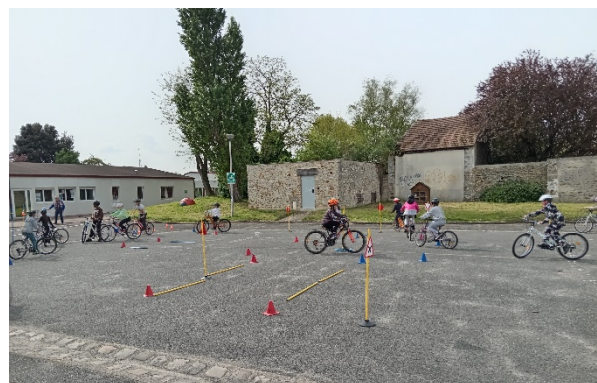
Bloc2 : Exercices de maniabilité et respect du code

Bondoufle : Le club a réalisé pour sa 13ème année consécutive, la formation au SRAV dans les 4 groupes scolaires. 6 classes de CM2 pour 154 élèves ont ainsi effectué le programme. Il faut regretter que certains parents ne s'inquiètent pas de l'état des vélos. Il faut revoir à chaque étape les vélos pour effectuer les exercices et déplacements en sécurité, surtout lors du bloc 3, pendant la pratique sur voirie en autonomie, pour les arrêts aux stops ou respect de la priorité à droite. Également le changement de vitesse qui ne peut être effectué avec un BMX, lors des exercices en montée et descente.