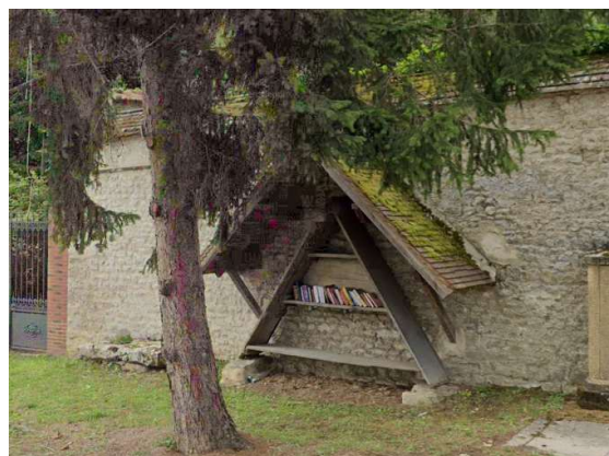
L'abri et le chasse-neige de Gironville

Si nous avons l'habitude de croiser des véhicules munis d'une lame lorsque la neige commence à paralyser les axes routiers, nos ancêtres ne possédant pas toute la technologie actuelle avaient des solutions face aux intempéries hivernales qui faisaient appel à la solidarité.