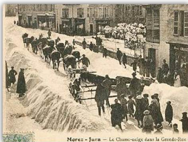
Morez - Jura - Le Chasse-neige dans la Grande-Rue

Les chasse-neige de type classique avec une forme triangulaire furent nombreux et firent l'objet de multiples brevets d'invention.