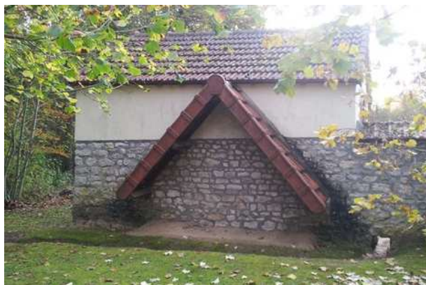
L'abri à chasse-neige de Vayres-sur-Essonnes

Lors d'une édition de la randonnée La Trans Sud Essonne VTT, un ravitaillement se situait face au cimetière de Vayres-sur-Essonnes. Il pleuvait et je me suis abrité sous un appentis. Sur le coup, je n'avais pas porté attention à ce toit très court à deux pans greffé sur le mur. Ce n'est que lorsque j'ai débuté le Geocaching® que j'ai découvert un début d'information. Le jeu indique qu'il y a d'autres abris de ce type en Essonne. Les randonnées VTT ne passant pas devant, je n'avais pas forcément le besoin d'aller sur ces sites. Mais c'est mon travail de traceur de parcours pour Véloenfrance qui m'a permis de me rapprocher des autres lieux. Les cyclotouristes sont certainement passés devant en ignorant leur existence.