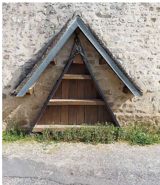
L'abri et le chasse-neige de Dannemois