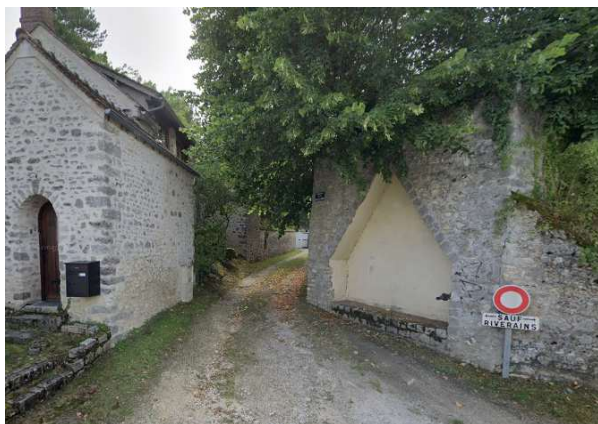
L'abri de Buno-Bonnevaux

Mais lors de ces recherches, j'ai retrouvé d'autres abris. Le premier se trouve au pied de l'église de Buno-Bonnevaux et le second abrite un kiosque à livres face au château de Gironville. Ils ont eux aussi été utilisés jusqu'en 1979