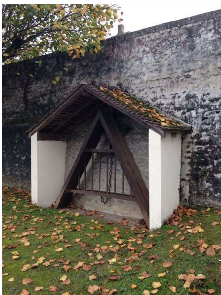
L'abri et le chasse-neige de Boigneville

Le Chasse-neige de Vayres-sur-Essonnes a disparu de son emplacement, mais il a servi pour la dernière fois en 1979 par les pompiers, tiré par un de leur camion, quand le village s'est trouvé enseveli par une épaisse couche de neige. Il n'avait pas servi depuis les années 30, à l'époque il était tiré par un ou deux chevaux.